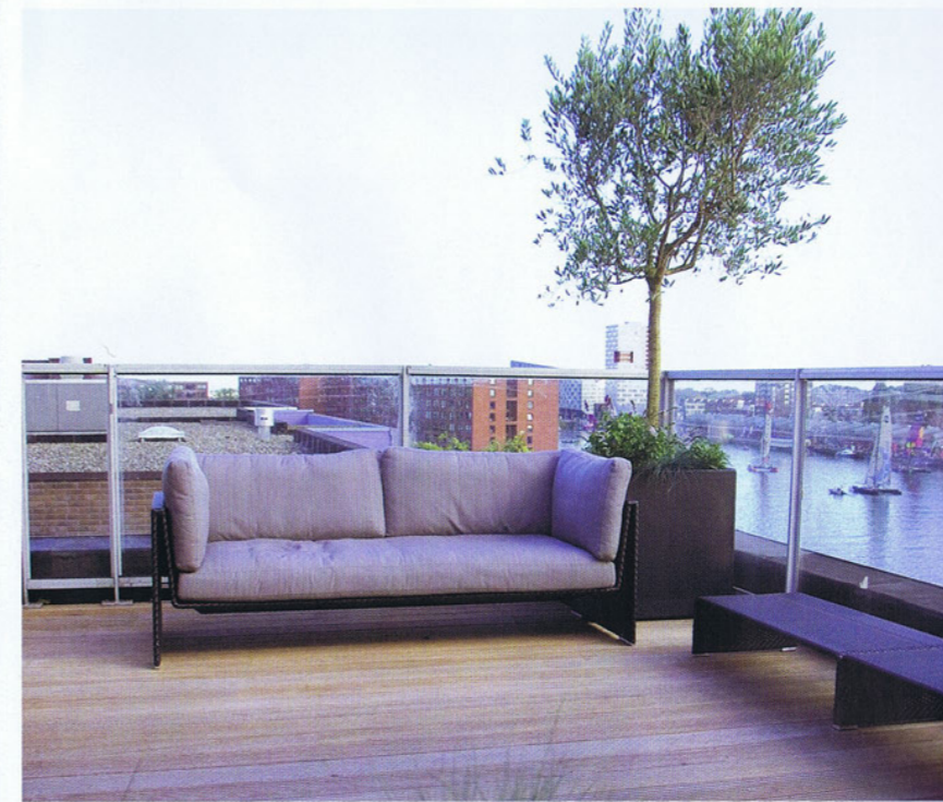
Heerlijk ontspannen op de 'Slim Line 4 Seater' van Dedon