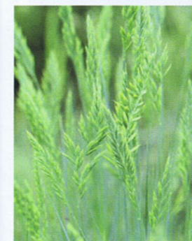
Laagblijvende siergrassen, zoals het blauwe schapengras ( Festuca glauca ), zijn heel geschikt in bakken. Doordat ze groen blijven, vormen ze een rustpunt in de winter

Aan de kant van de burens staan extra grote bakken met bamboe. In andere bakken zijn Nieuw-Zeelands vlas ( Phormium ), olijfbom ( Olea europaea ) en vijg ( Ficus carica ) geplant, met een onderbeplanting van blauw schapengras ( Festuca glauca ). Deze planten komen van oorsprong voor in een klimaat zoals dat heerst rond de Middellandse Zee en in meer gematigde streken. Het is daarom noodzakelijk ze vanaf oktober goed in te pakken tegen de kou.