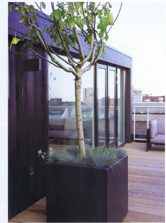
De olijfbom heeft het deze winter net gered dankzij de goede verzorgingsmaatregelen