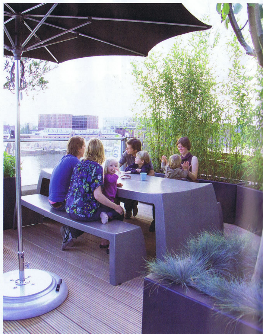
Genieten van het uitzicht aan de tafel van het Nederlandse merk 'One to Sit'