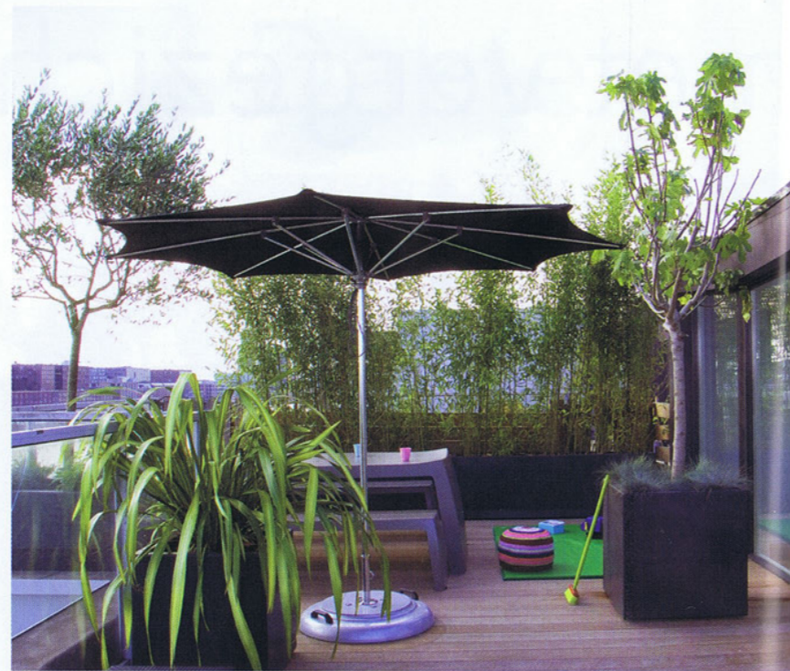
Aan de kant van de burens staan extra grote mobiele bakken met bamboe – WWW.LINNENENOLIJF.NL

Ten opzichte van planten die in de grond staan vragen planten in potten meer zorg. Het vocht verdampt snel bij droog en zonnig weer, vooral in poreuze potten. Ook aan bemesting moet extra aandacht worden besteed, omdat de grond in potten en bakken sneller uitgeput is.