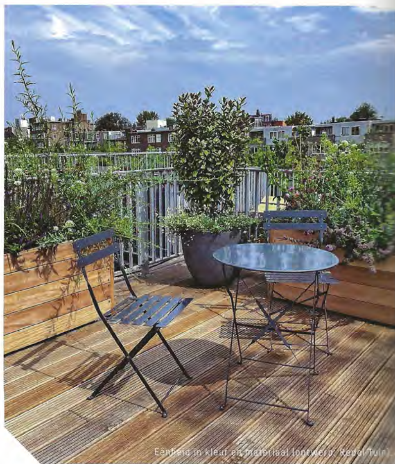
Eenheid in kleur en materiaal ontwerpt Rebel Tuin

Allereerst is een draagkrachtberekening nodig; je moet immers zeker weten of het dak de ballast aankan.