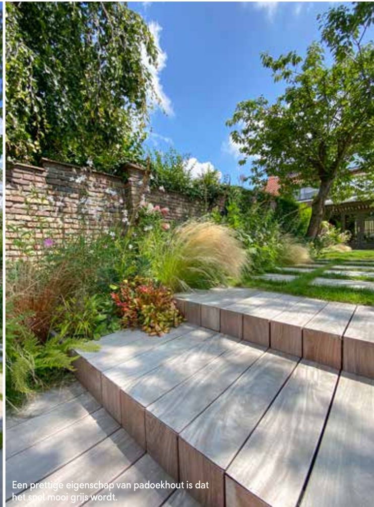
Een prettige eigenschap van padoekhout is dat het spel mooi grijs wordt.