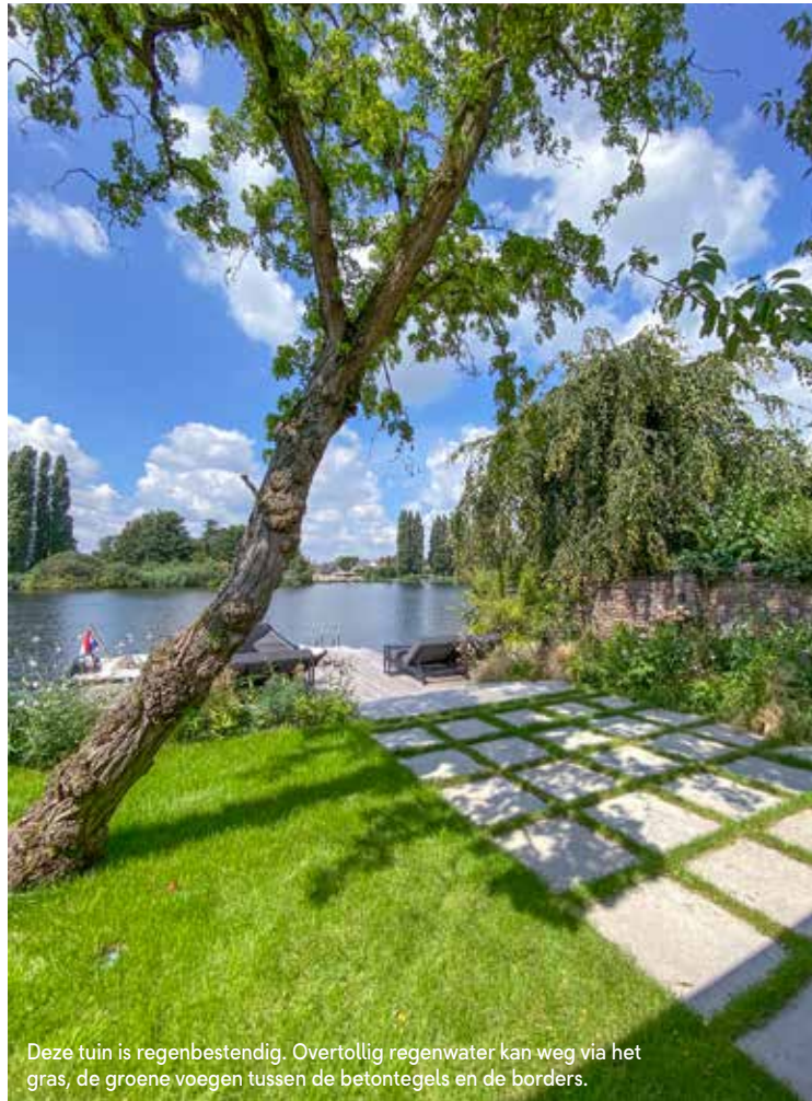
Deze tuin is regenbestendig. Overtollig regenwater kan weg via het gras, de groene voegen tussen de betontegels en de borders.