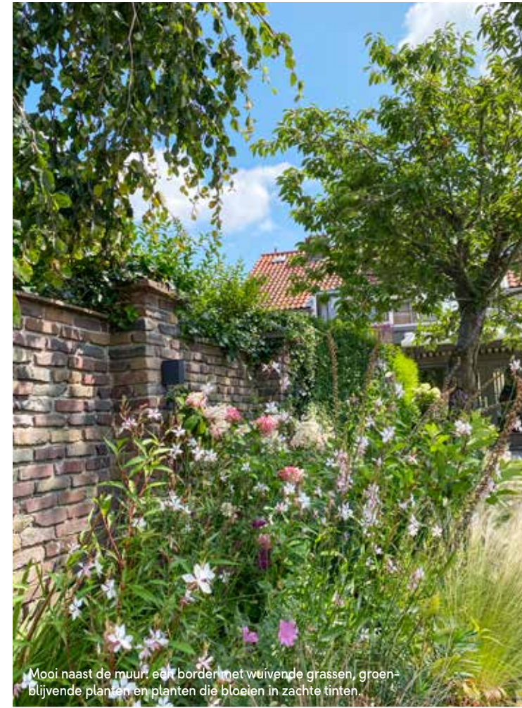
Mooi naast de muur: een border met wuivende grassen, groenblijvende planten en planten die bloeien in zachte tinten.