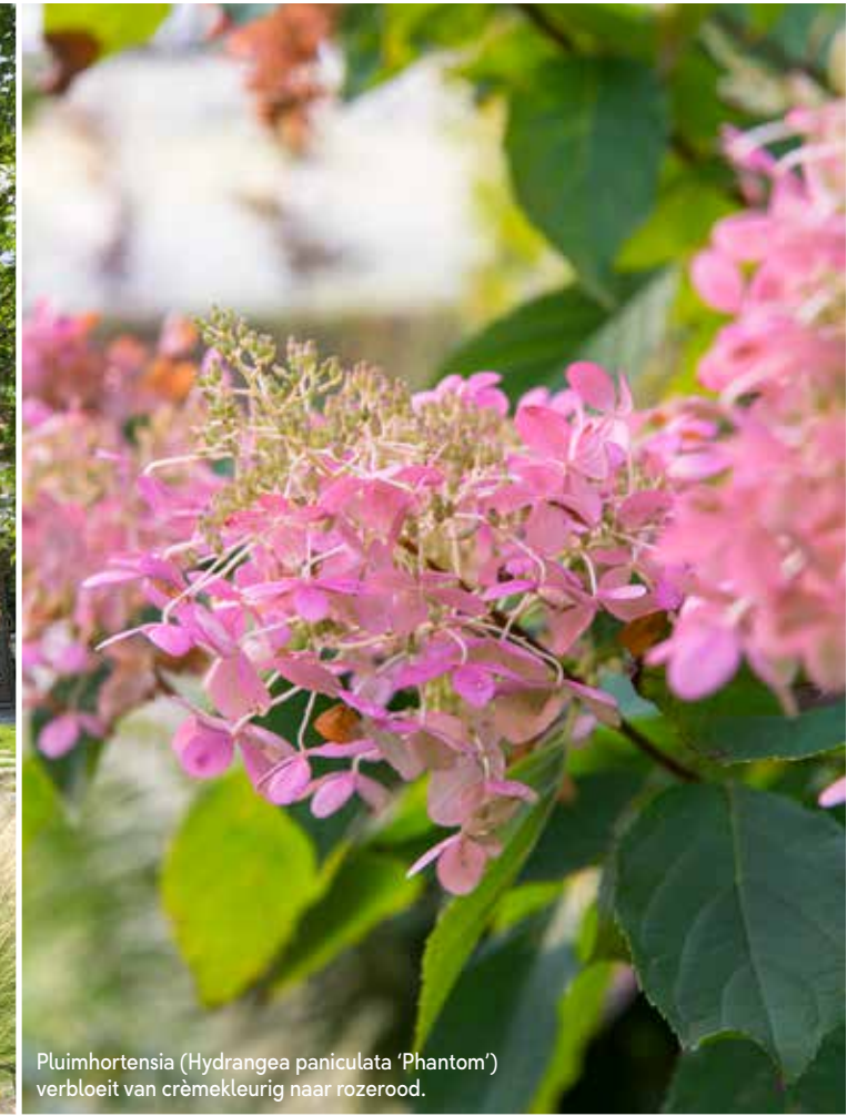
Pluimhortensia ( Hydrangea paniculata 'Phantom') verbloeit van crèmekleurig naar rozerood.