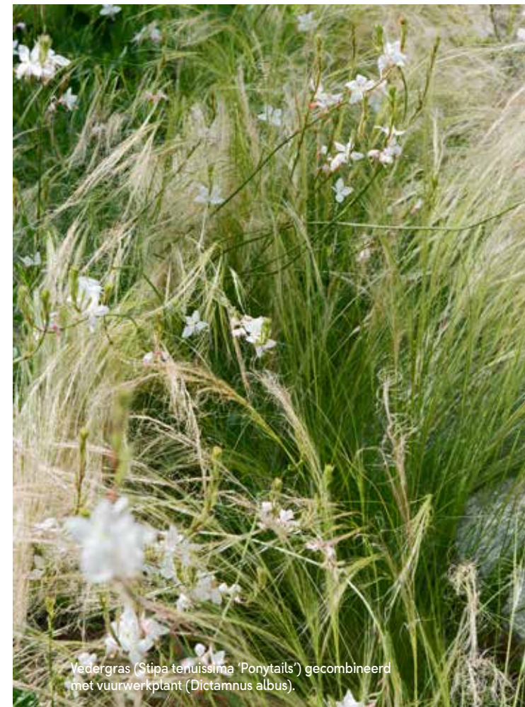
Vadergras ( Stipa tenuissima 'Ponytails') gecombineerd met vuurwerkplant ( Dictamnus albus ).

Een weloverwogen lichtplan maakte deel uit van het ontwerp. In de traptreden zijn opbouwspots verwerkt die je overdag niet ziet. Dat geldt ook voor de verlichting in de borders en de spots die de bomen mooi uitlichten. Alleen de wandspots zijn zichtbaar aanwezig. De tuin wordt nu van de vroege ochtend tot laat in de avond optimaal benut. Als het maar even kan zit het gezin buiten. Op mooie dagen wordt er gevaren en duiken de pubers zo vanaf de aanlegsteiger het water in. Erwin: “Dat is het belangrijkste als je een tuin aanlegt: dat het voor de opdrachtgevers een plek is die goed voelt, een plek waar je graag wilt zijn. Dat is met deze tuin aan ‘het Waaltje’ zeker gelukt.” erwinstam-tuinstudio.com