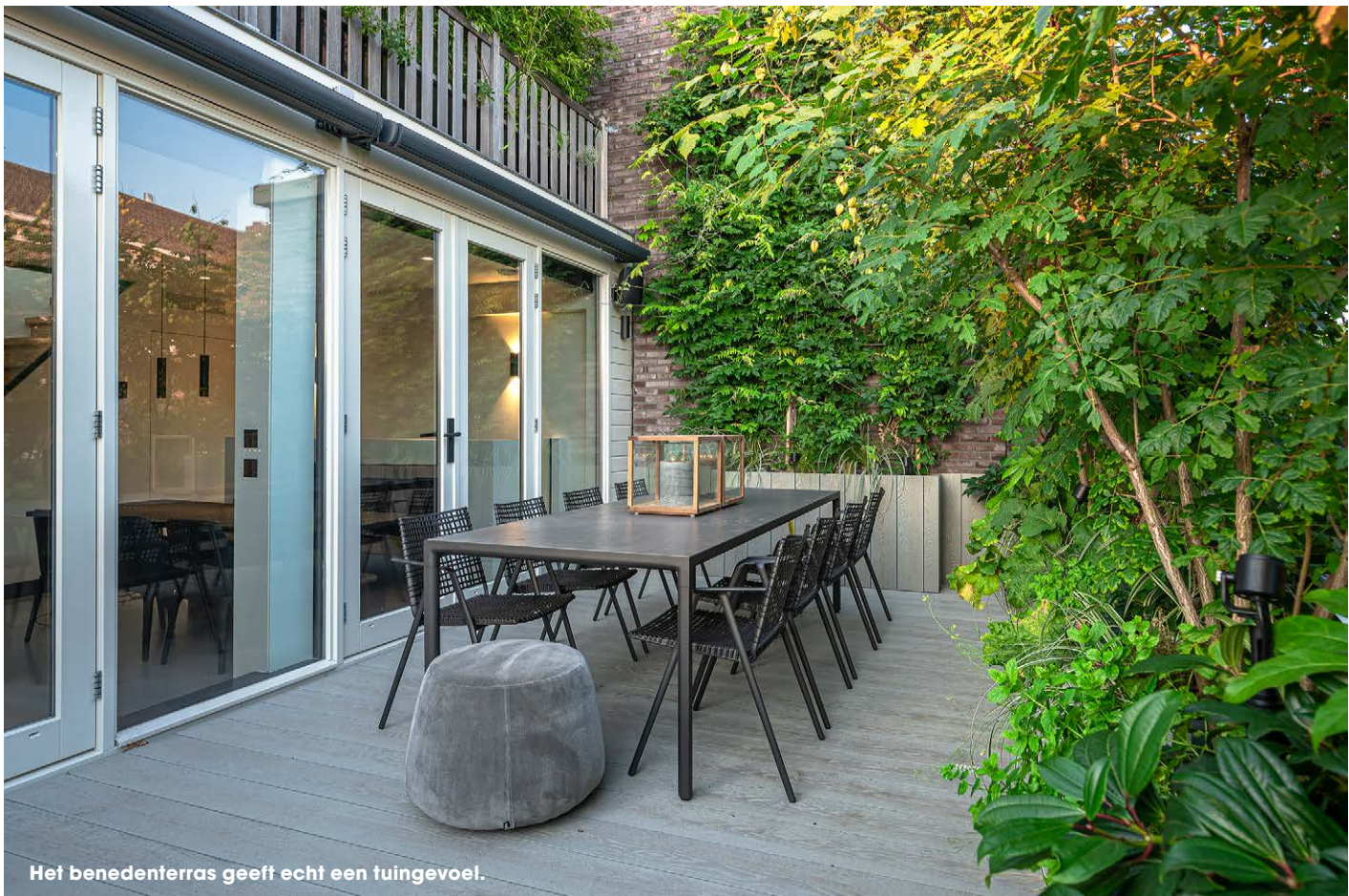
Het benedenterras geeft echt een tuingevoel.

Op het dakterras is Erwin meteen gecharmeerd van de schoorstenen, die her en der zichtbaar zijn op omringende daken. "Ik heb die schoorstenen door middel van het lichtplan extra benadrukt: ze geven een grootstedelijk en eigenlijk ook wel typisch Amerikaans gevoel." In het lichtplan zijn zowel in-lite wandspots tegen de panelen als richtspots in de plantenbakken opgenomen. De grote, op zichzelf staande bollen zijn van HORA Barneveld, net als het terrasmeubilair. "Ideaal is natuurlijk dat alles het hele jaar door buiten kan blijven staan. Ook in ons Nederlandse klimaat."